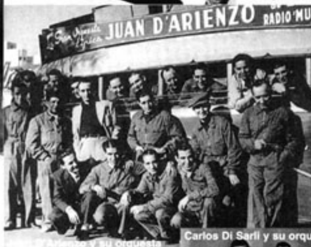
Juan D'Arienzo y su orquesta