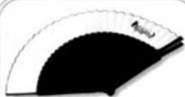
Abanico 1.200.- Pts.

Los interesados deben hacer su encargo dejando un mensaje en el teléfono 91.521 70 24, además de su nombre, un teléfono de contacto y el número de socio de Tangoneón, en caso de serlo.