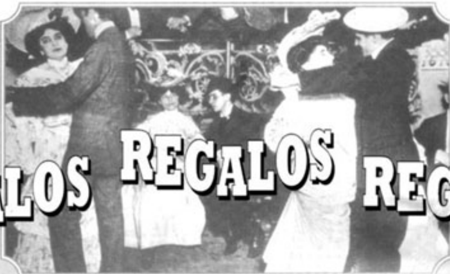
Bolsa para zapatos 800.- Pts.