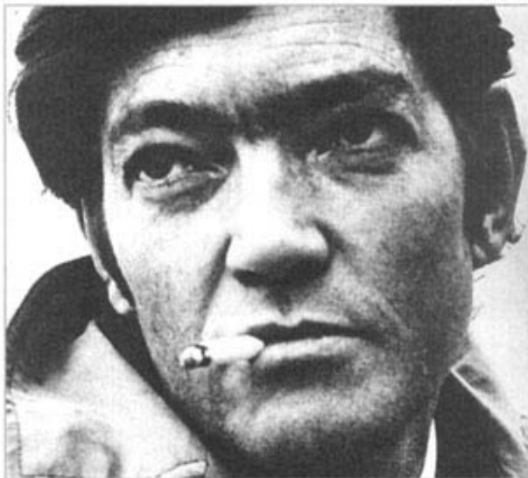
Julio Cortázar

Para muchos de nosotros el descubrimiento de sus cuentos breves en la fiebre entusiasta de nuestras primeras lecturas adolescentes fue la fascinación de sumergirnos en mundos fantásticos, en los que te veías atrapado de modo irremediable desde las primeras frases; mundos que te hacían perder contacto con la aburrida realidad que te rodeaba, que te arrastraban hasta formar parte de ellos y de los que, después de haber llegado al punto final, lograbas recuperarte poco a poco. En uno de sus cuentos, Las puertas del cielo , describe de forma sugestiva el ambiente de una milonga de los años cuarenta en Buenos Aires: