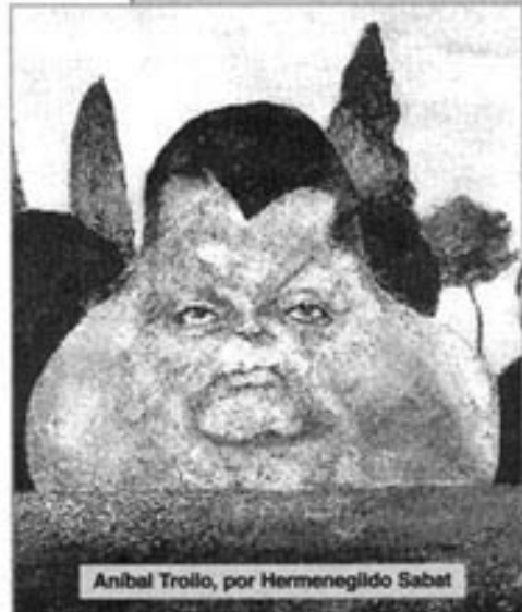
Anibal Troilo, por Hermenegildo Sabat

... EN una "orquesta de señoritas" siempre había un hombre, y que normalmente el piano lo tocaba una gorda, y el violín una flaca, y que fue en una de estas orquestas donde Anibal Troilo hizo su debut oficial, a los trece años en el café Ferraro, aunque a los 10 años hizo su primer debut amistoso tocando "Canaro en París" en el Petit Colón. ♦